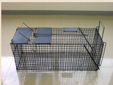
① セット開始します。