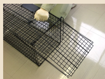
③ 持ち手ハンドルを倒すようにして侵入扉を開けます。