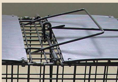
※ エサ掛けフックとストッパーのセット穴位置を写真のようにします。