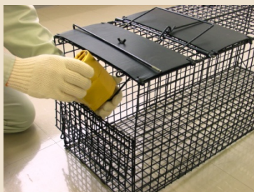
⑦ エサ掛けフックを手前に引き出し、エサをフックに掛けます。