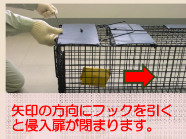
矢印の方向にフックを引くと侵入扉が閉まります。