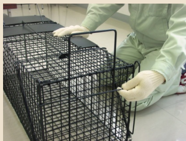
② ストッパーを上にあげます。