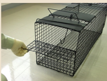
⑥ バーを抜き取り、扉を開けます。