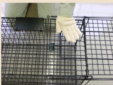
④ 持ち手ハンドルを押さえ、ストッパーをハンドルの上にセットします。